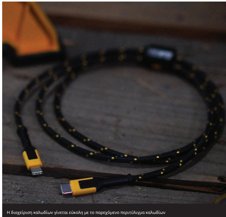
Η διαχείριση καλωδίων γίνεται εύκολη με το παρεχόμενο περιτύλιγμα καλωδίων