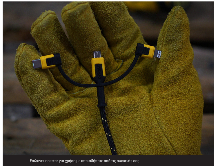
Επιλογές plector για χρήση με οποιαδήποτε από τις συσκευές σας